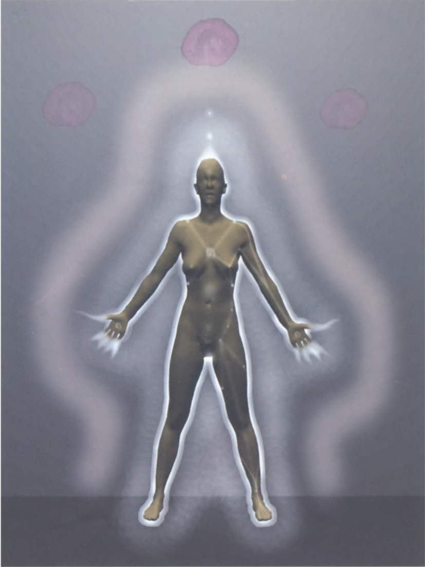
Aura dynamisée par des Formes-pensées d'Amour.